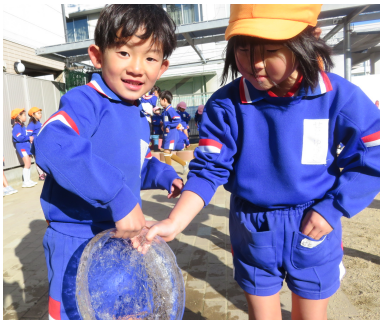
○参観ありがとうございました (写真は2歳児クラス)

前日にバケツに水を入れて氷になるのを楽しみにしていた年長さん。 翌朝、厚い氷ができていました！「見せて」「触りたい」と年少さんも興味津々！ 寒い季節も子どもたちはとっても元気です。