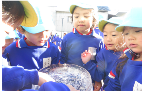
○なわとび練習中です！！